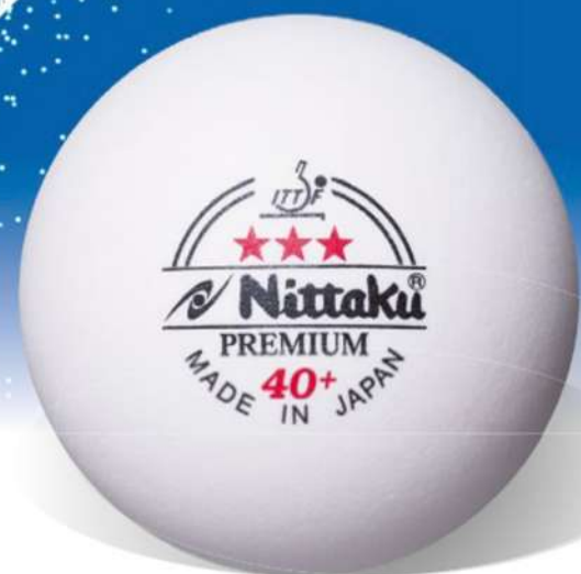
NITTAKU PREMIUM 40+ ★★★ CELL-FREE